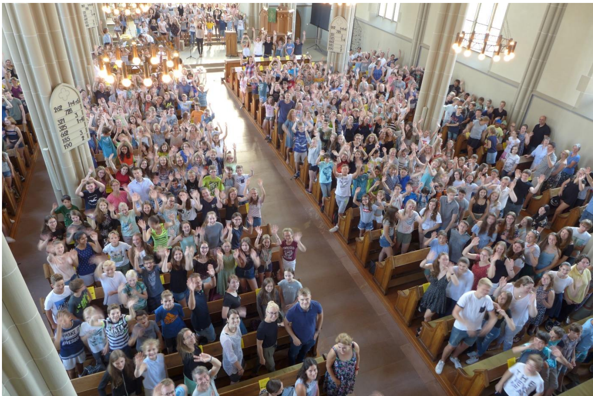
Bericht von Johanna Heilemann, Jennifer Wüst und Katja Kamuf